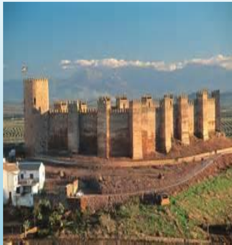
CHÂTEAU DE BAÑOS DE LA ENCINA.