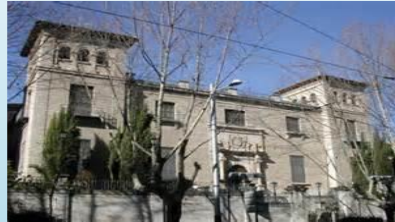
MUSÉ PROVINCIAL DE BEAUX ARTS