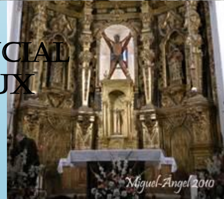
CHAPELLE DE SAN ANDRÉS