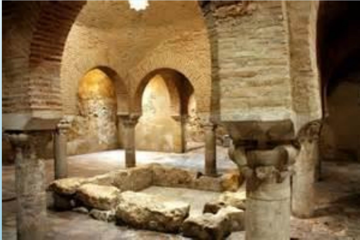
BAINS ARABES DU JAÉN.